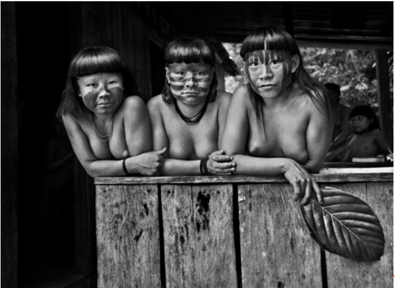
Indiennes Zuruahã, État d'Amazonas, Brésil, 2017