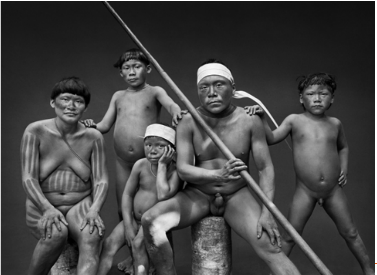
Famille Korubo, État d'Amazonas, Brésil, 2017