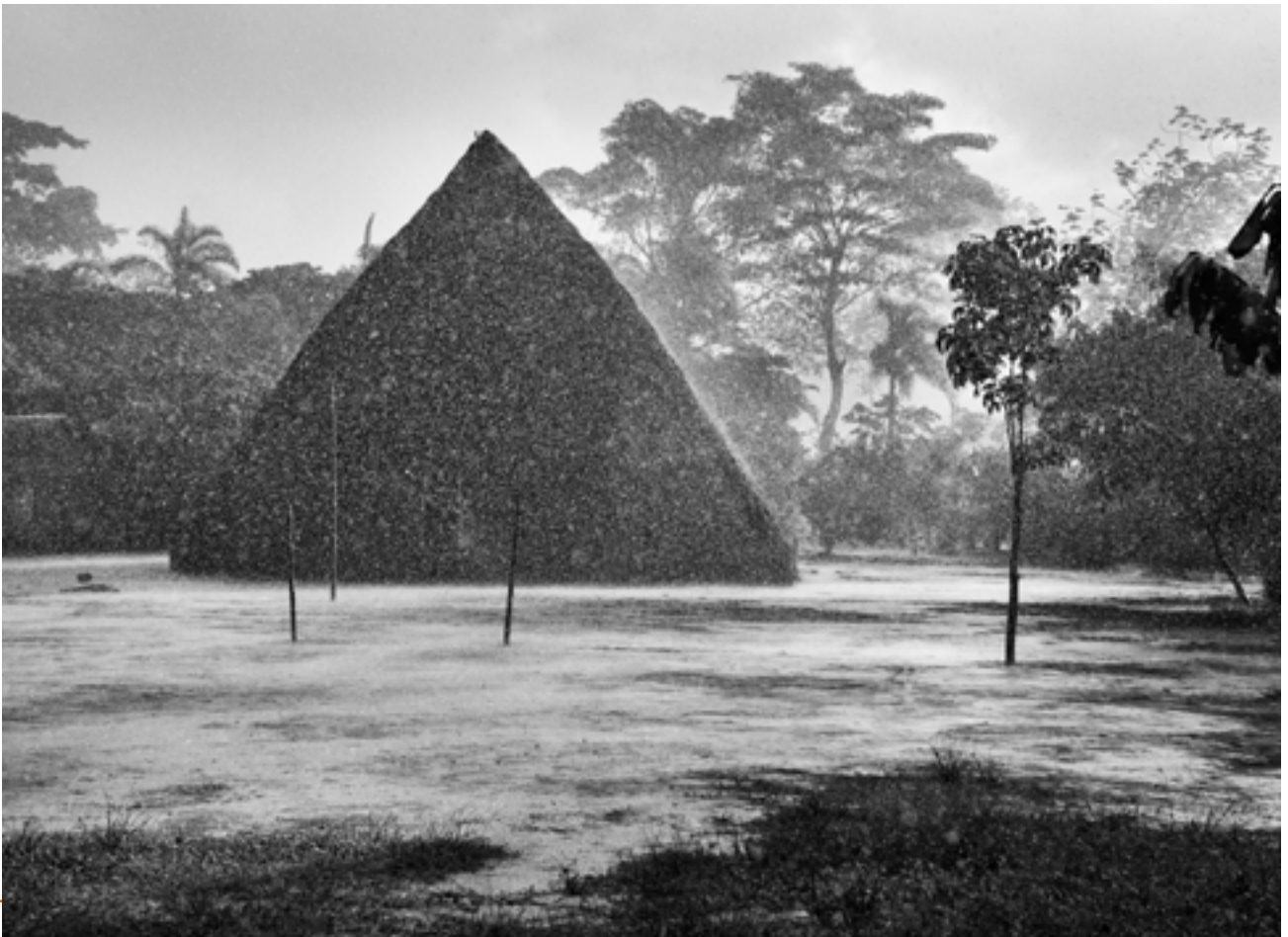
Une pluie intense sur le village de Mati-Kéyawaia. Au centre, la hutte de Masempapa. Territoire indigène de la vallée de Javari. État d'Amazonas, Brésil, 1998