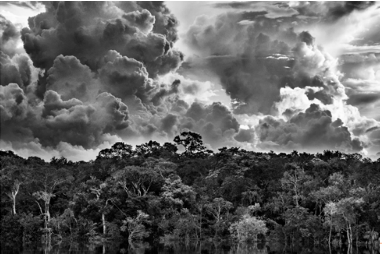
Archipel fluvial de Mariuá, Rio Negro, État d'Amazonas, Brésil, 2019