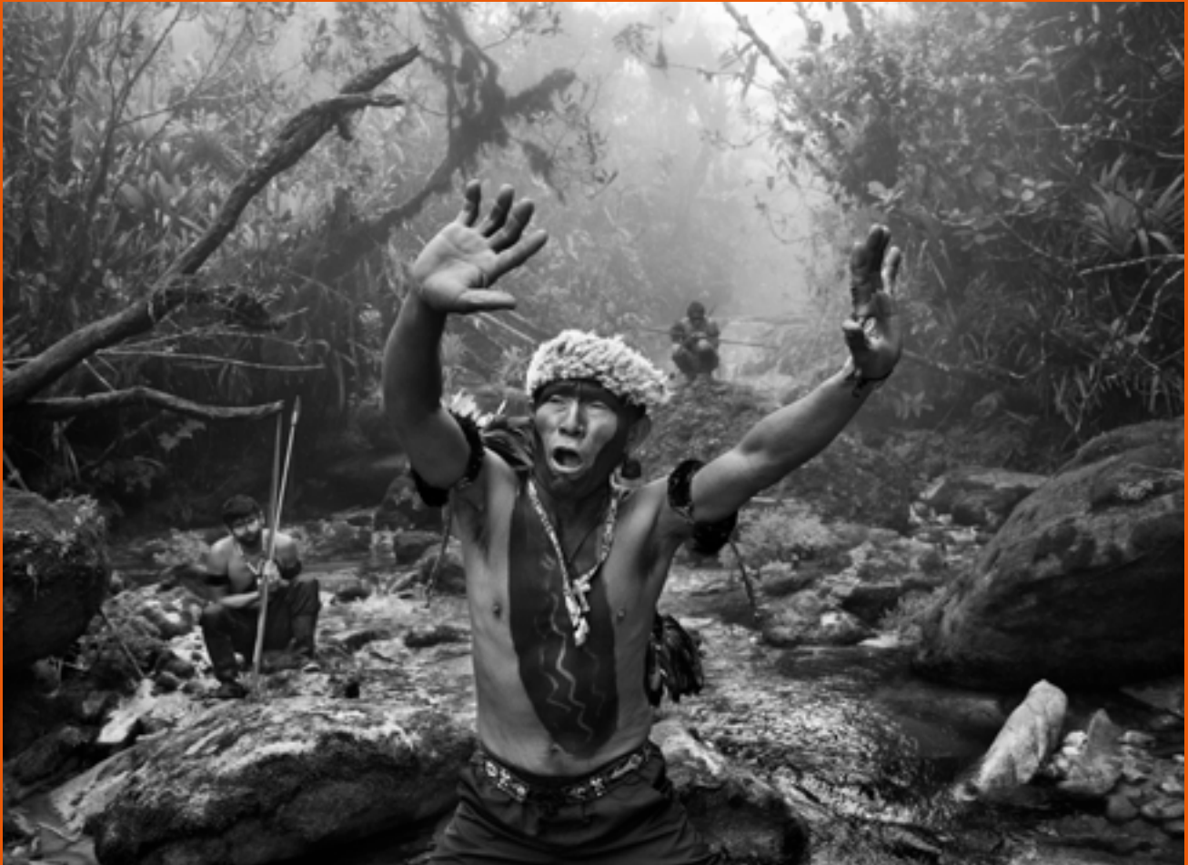
Chaman Yanomami en rituel avant la montée vers le Pico da Neblina, État d'Amazonas, Brésil, 2014