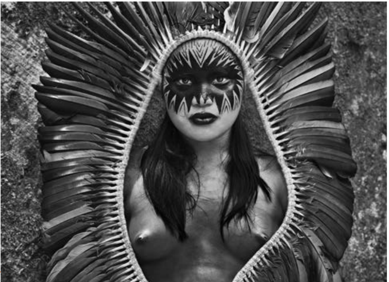
Indienne Yaminawá, État d'Acre, Brésil, 2016