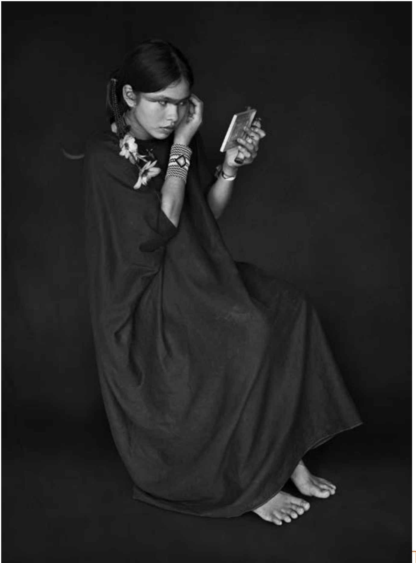
Indienne Ashaninka, État d'Acre, Brésil, 2016