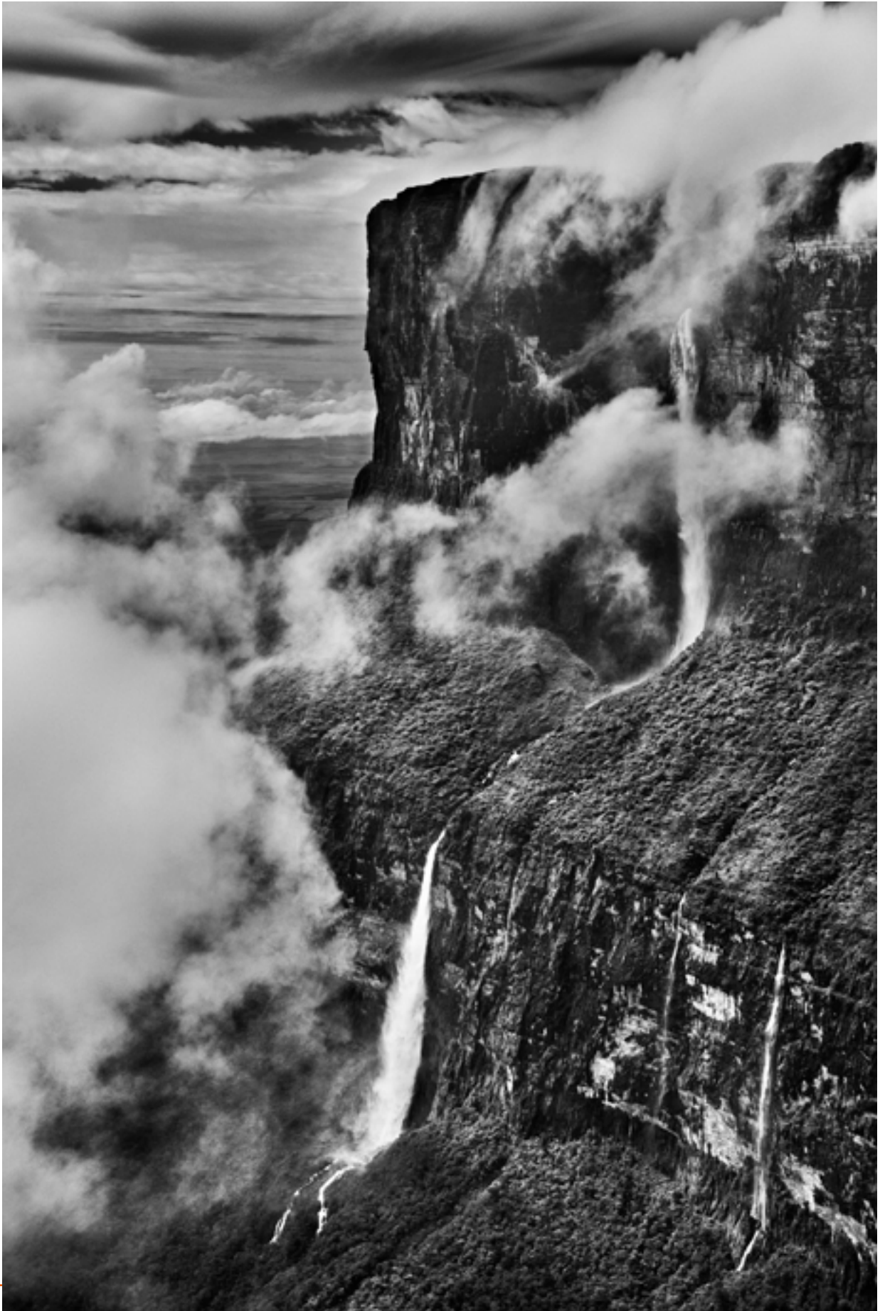
Mont Roraima, État de Roraima, Brésil, 2018 © Sebastião Salgado