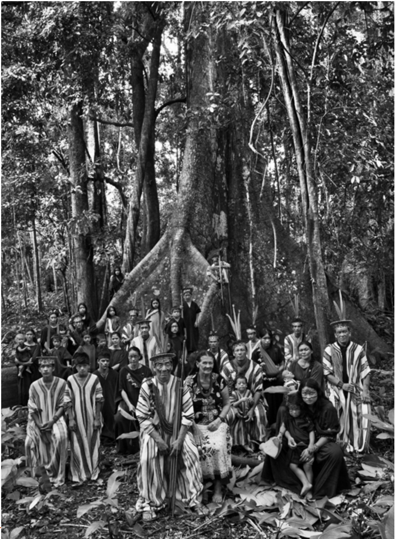
Famille Ashaninka, État d'Acre, Brésil, 2016