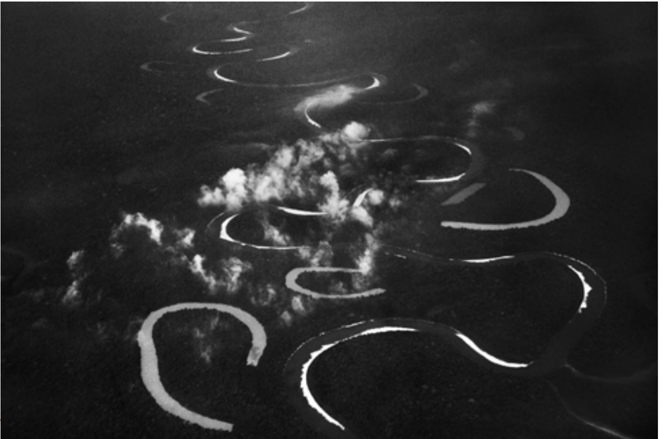
Rio Jutá, État d'Amazonas, Brésil, 2017