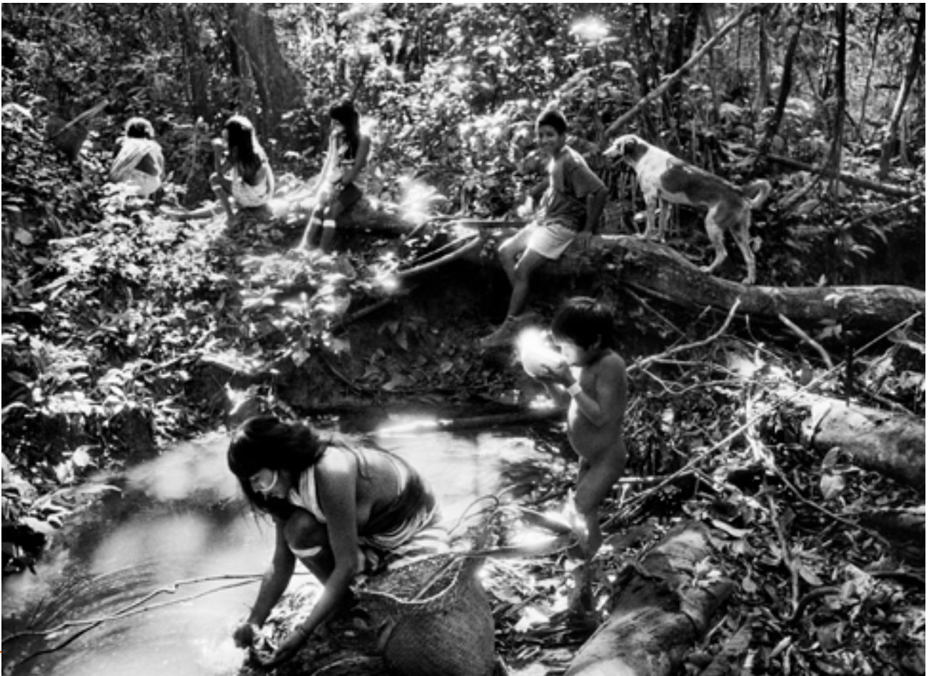
Indiens Marubo, Vallée de Javari, État d'Amazonas, Brésil, 1998 © Sebastião Salgado