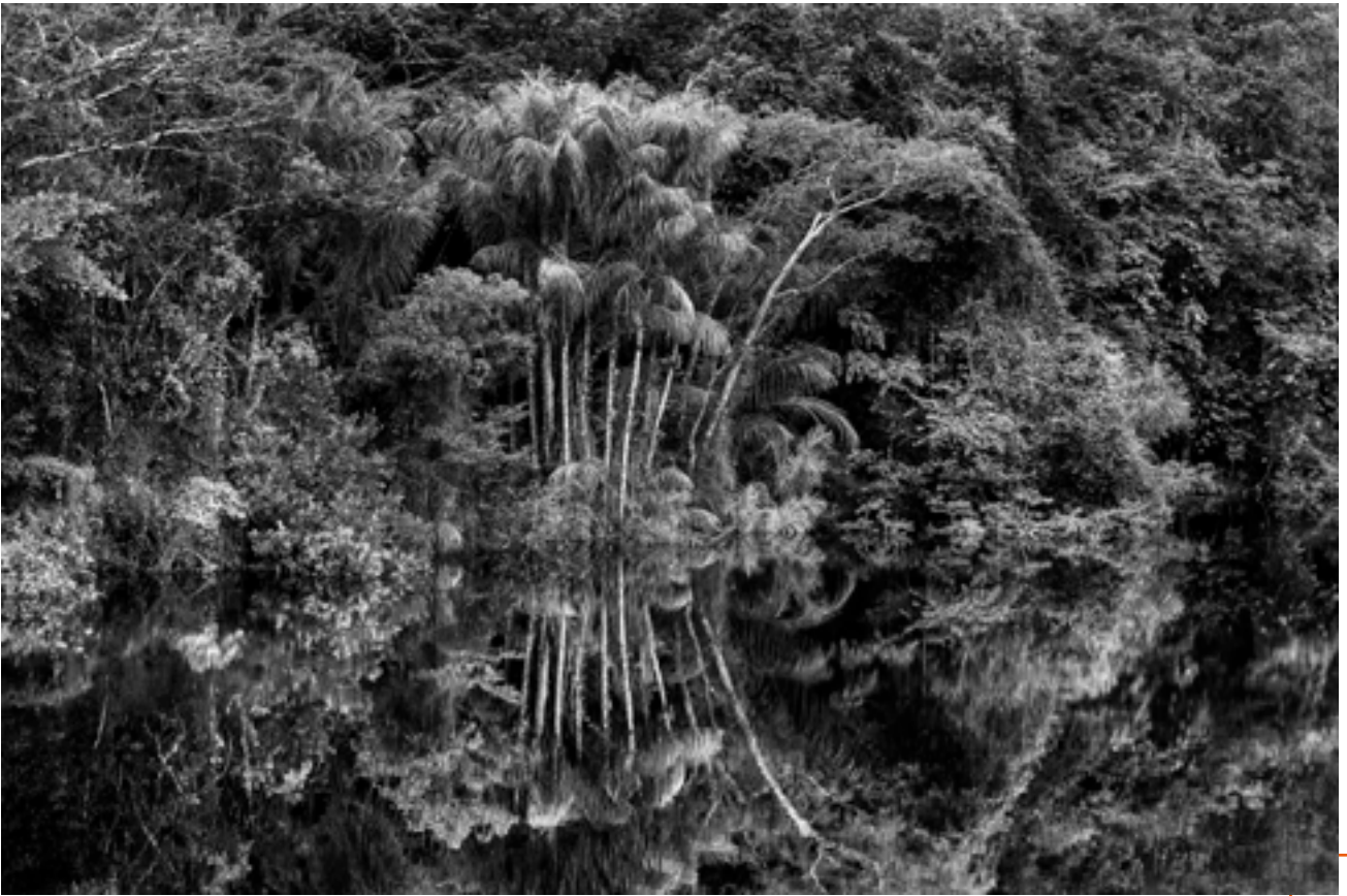
Rio Jutá, État d'Amazonas, Brésil, 2019