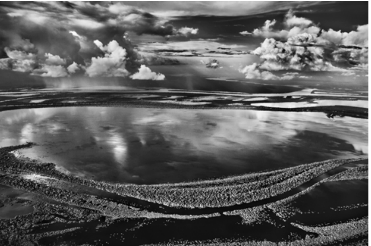
Îles Anavilhanas, îles boisées du Rio Negro, État d'Amazonas, Brésil, 2009