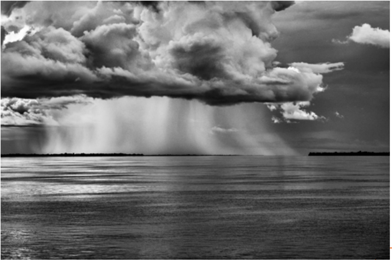
Rio Negro, État d'Amazonas, Brésil, 2019